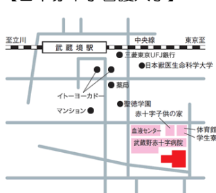
【日本赤十字看護大学】