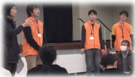
学生災害救護サークルメンバーと共に