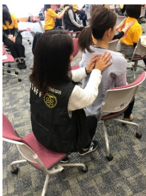
リラクソスのスキルで

今年は、7月に西日本豪雨災害が起きました。皆様の備えが重要です。ぜひご参加ください。