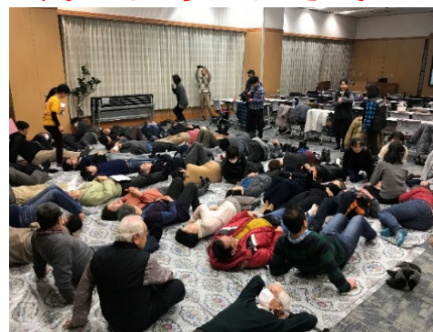
夜間の避難所訓練