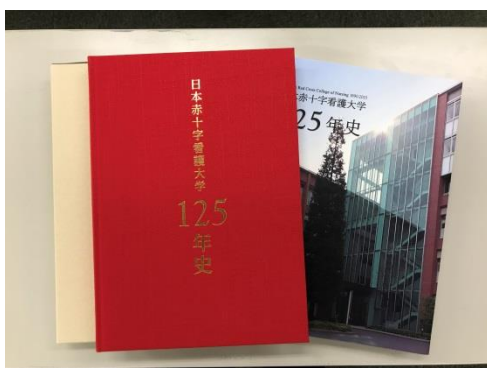
記念誌 (装丁版、普通版)