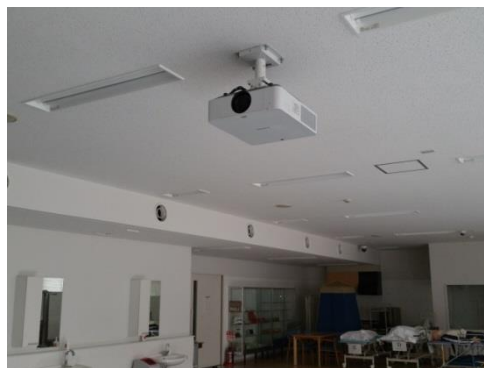
実習室プロジェクター