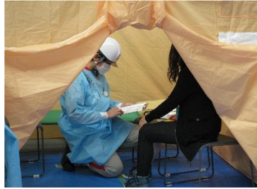
<診察と処方箋作成>