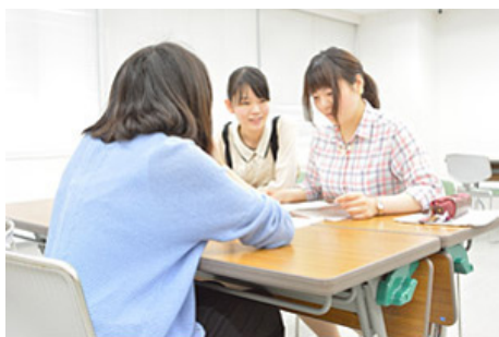
進路相談を行いました。在校生とも話せる機会です。