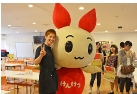
けんけつちゃん 「献血」を多くの人に知ってもらい、参加してもらうために 【けんけつちゃん】に登場してもらいました。