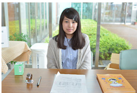
受付 受付おつかれさまでした！