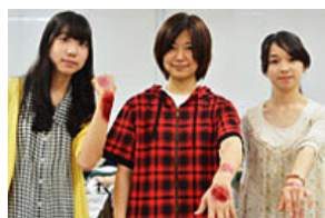
災害時に大切な命を守るように自分がどう動いたらいいのか、もしもの時に備える活動をしています。心肺蘇生法体験、傷病者メイクなどをおこないました。