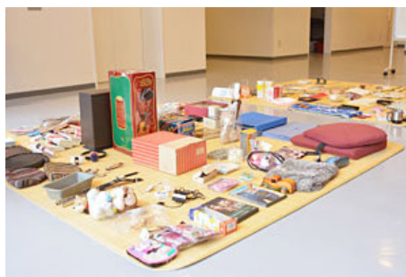
学生自治会のバザー。売上げは日本赤十字社に寄付されます。