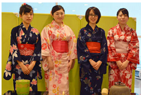
おいしいお抹茶と和菓子でおもてなし。