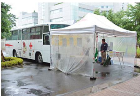
献血 ご協力ありがとうございました！