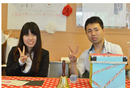
スタンプラリー スタンプラリー楽しんでもらえましたか？