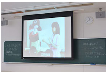
NACEF カンボジアの孤児院を訪れ健康診断や健康教育を行っています。 今年はその内容を映像で紹介しました。