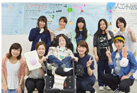
EFCボランティアサークル ボランティアで、医療ケアの必要な障害をもつお子さんとその ご家族の支援をしています。普段の活動内容を展示しました。