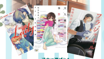
過去に選ばれた医療関係の漫画や小説