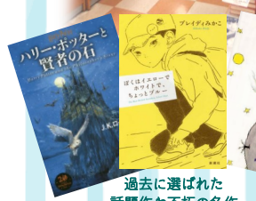
過去に選ばれた話題作や不朽の名作