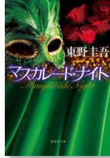
『マスカレード・ナイト』 東野, 圭吾 文庫(913.6/H)