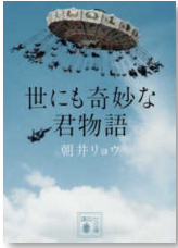
『世にも奇妙な君物語』 朝井, リョウ 文庫(913.6/A)

10月～12月中旬までテーマ展示コーナーにて、オススメ本を展示しています。ぜひ手に取ってみてください!!