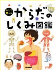
『めくって学べる からだのしくみ図 鑑』阿部, 和厚 (QT/104/M)

「どうなってるの？からだのなか」 「めくって学べるからだのしくみ図鑑」 は、ページを開くと扉があいて中の臓器が みえる仕掛け絵本のような感じです。 体のなかはどうなっているんだろう?? とドキドキしながら子どもが楽しめる 絵本のような専門書です。