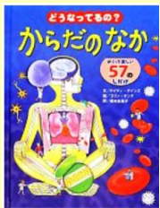
『どうなってるの？ からだのなか』 ケイティ デインズ (QT/104/D)

テーマは「からだの不思議」。夏休み駆け込み講座キッズカレッジとして開講しました。 その中で、小学生やお母様たちが手に取ってくれた本を紹介します。