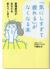
『「気にしすぎて疲れる」 がなくなる本』 下園, 壮太 (WM/105/S)