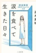
『涙を食べて生きた日々』 摂食障害-体重28.4kgからの生還』 道木, 美晴 WM/175/M