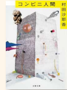
『コンビニ人間』 村田, 沙耶香 913.6/M