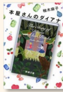
『本屋さんのダイアナ』 柚木, 麻子 913.6/Y