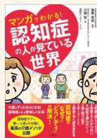
『おまじないマンガでわかる! 認知症の人が見ている世界』 川畑, 智他 WT/155/K