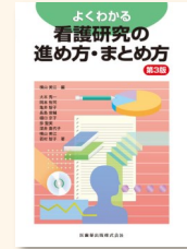
『よくわかる看護研究の 進め方・まとめ方』 横山, 美江 WY/20.5/Y