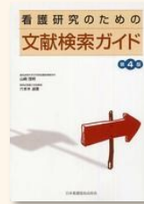
『看護研究のための 文献検索ガイド』 山崎, 茂明 (WY/26.5/Y)