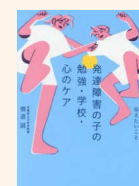
『発達障害の子の勉強・学校・心の ケア』横道, 誠 WS/350/Y