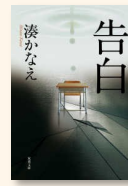
『告白』 湊, かなえ 913.6/M