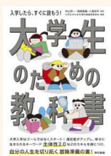
『大学生のための教科書』 中山, 芳一 他 377.9/D