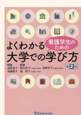
『看護学生のためのよくわかる 大学での学び方』 前原, 澄子 WY/18/Y