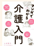
『マンガでわかる介護入門』 上田, 惣子 他 369.26/U