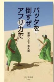
『バツタを倒すぜアフリカで』 前野, ウルド浩太郎