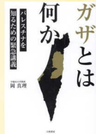
『ガザとは何か パレスチナを知るための緊急講義』 岡, 真理 (302.2/O)