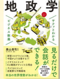
『地政学』奥山, 真司 (312/C)