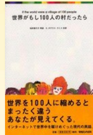
『世界がもし100人の村だったら』 池田, 香代子 (304/S/1)