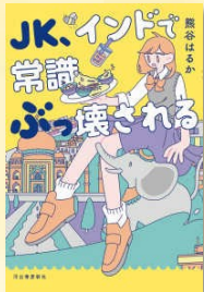
『JK、インドで常識ぶっ壊される』 熊谷, はるか (292/K)