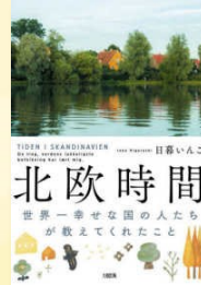
『北欧時間』 日暮, いんこ (590/H)