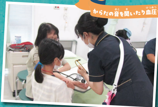
からだの音を聞いたり血圧をはかるよ