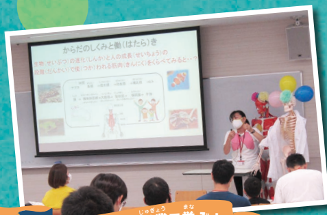
からだの仕組みを授業で学ぼう